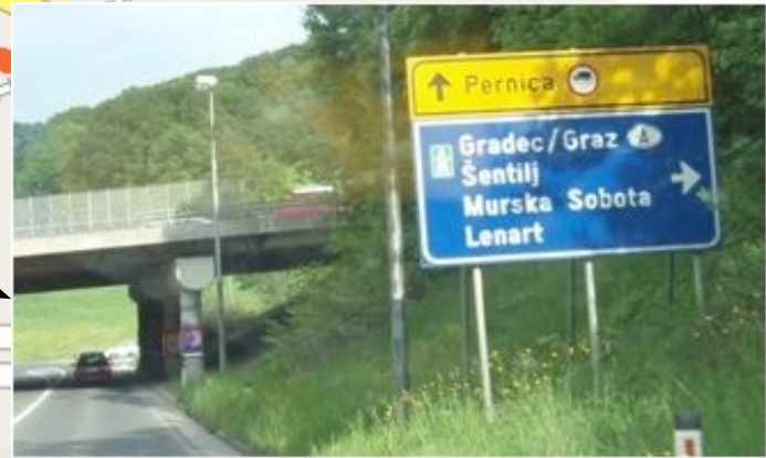
Odbočte vpravo na Šentilij (viz. poznámka č.1)