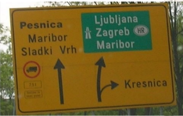
Držte se vlevo – směr Pesnica / Maribor