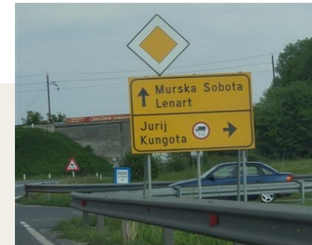
Odbočte doprava na Jurij a poté se řid'te ukazateli na Maribor centrum