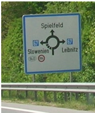
Odbočte na Slovinsko