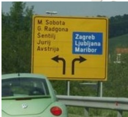
Odbočte vlevo na Šentilij