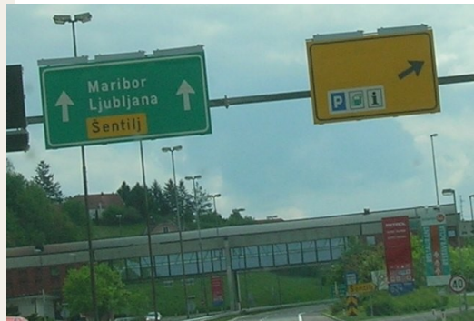
Jestliže jste neodbočili u exitu na Spielfeld, řiďte se záhadně prázdnou žlutou značkou