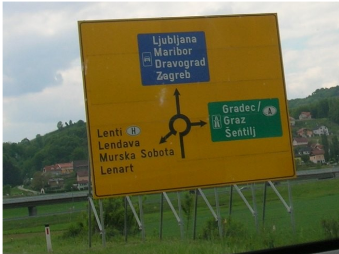
Odbočte na Lenart